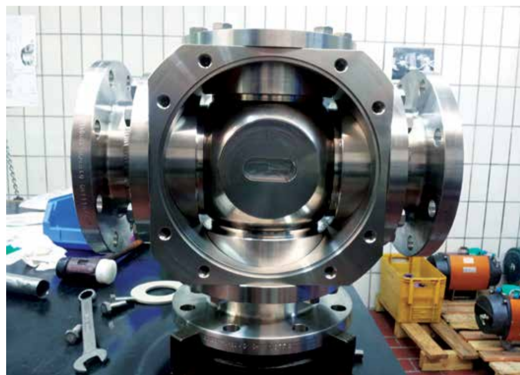
Der Drei-Wege-Kugelhahn ist metallisch dichtend und tottraumfrei

und erweitern“, betont der ATEC-Geschäftsführer. „Wir wollen nicht stehen bleiben, sondern immer auf der