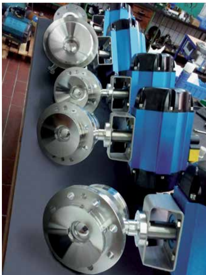
Bodenablass-Kugelhahn für die Pharmaindustrie

Auch beim Schweißen legen die ATEC-Mitarbeiter selbst Hand an