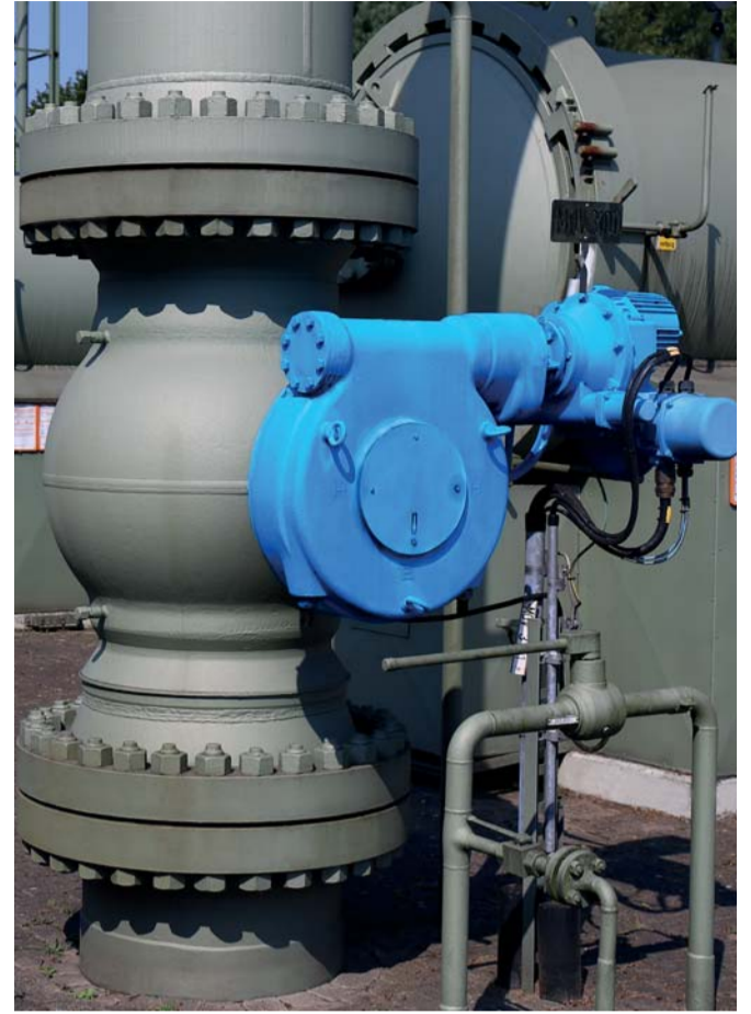
DN600 PN100 Superbloc Absperrkugelhahn Einsatz in einer Gasverdichterstation

artec AIS zusammen. Und das an gleich zwei Standorten.