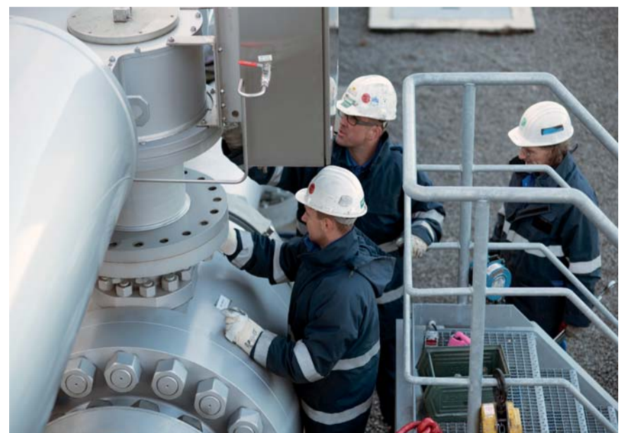
Vor Ort Service an einem DN600 PN250 Notabsperrkugelhahn