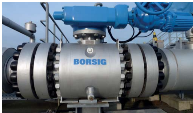
Einsatz eines DN300 PN250 Regelkugelhahns in Split Body Ausführung in einem Gaskavernenspeicher

kundenspezifische Armatur greifen wir nicht aus dem Regal. Sie darf auch nur in der dafür vorgesehenen Position im System verbaut werden“, erläutert Matthias Witt. Anlagen-tests sowie Simulationen gehören in der Forschungs- und Entwicklungsabteilung zur Tagesordnung. Bei Kleinteilen und für Prototypen kommt hier und da auch die additive Fertigung zum Einsatz, darüber hinaus sei dieses Verfahren für die Produktion jedoch aktuell keine Option, berichtet Witt: „Natürlich beobachten wir die Entwicklungen in diesem Bereich, aber gerade bei rein metallisch dichten Armaturen kommt es