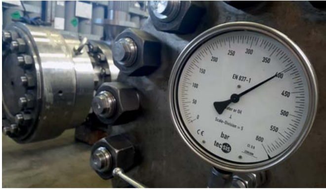
Absperrarmaturen im Gehäuse-Drucktest