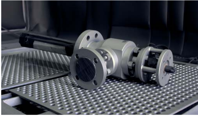
Heißdampfkühler vorbereitet zur Lackierung