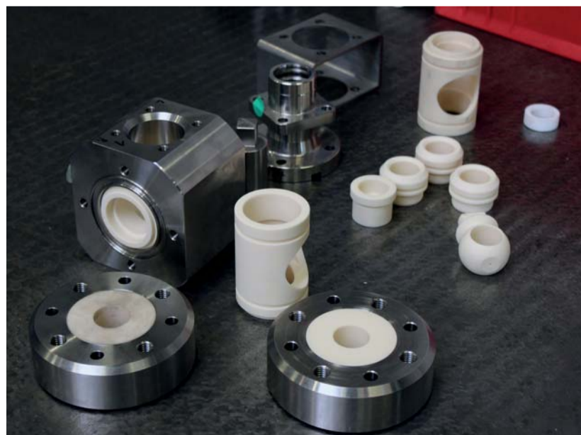
Sonderkugelhahn in Keramikausführung für stark abrasive Medien, PN16 DN50