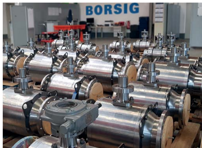
Regelkugelhähne DN 100-250, PN16 Regelung von Speisewasser

die leittechnische Einbindung. Unsere Kunden bekommen den kompletten Service aus einer Hand.“ Service, Ersatzteile und die individuelle Armaturenfertigung – das Angebot rund um das Armaturengeschäft ist nun in der BORSIG ValveTech GmbH gebündelt und wird durch die anderen Geschäftsbereiche des Konzerns, wie beispielsweise den Kraftwerksservice, ergänzt. Vor der artec AIS-Übernahme hatte das Unternehmen sich in den vergangenen 20 Jahren im Armaturengeschäft auf den Ersatzteil- und Servicebereich beschränkt. „Von den 60er bis in die 90er Jahre war die Armaturenfertigung ein wichtiges Standbein von BORSIG“, weiß Witt zu berichten. Seit Juni vergangenen Jahres trifft dieser traditionelle Zweig mit dem Know-how von