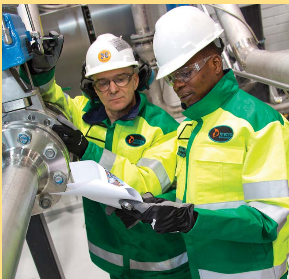
Mitarbeiter von Metso bei der Arbeit

ValveTriage Service ist ein neuer Weg zur Verwaltung des Feldgerätezustands und der Leistung von Regelventilen in Industrieanlagen. Der Service basiert auf Prozessdaten zum Diagnostizieren und Priorisieren von Geräteproblemen, erklärt Metso. Diese Konzentration der Wartung auf Geräte, die es am meisten benötigen, führe zu messbaren Einsparungen.