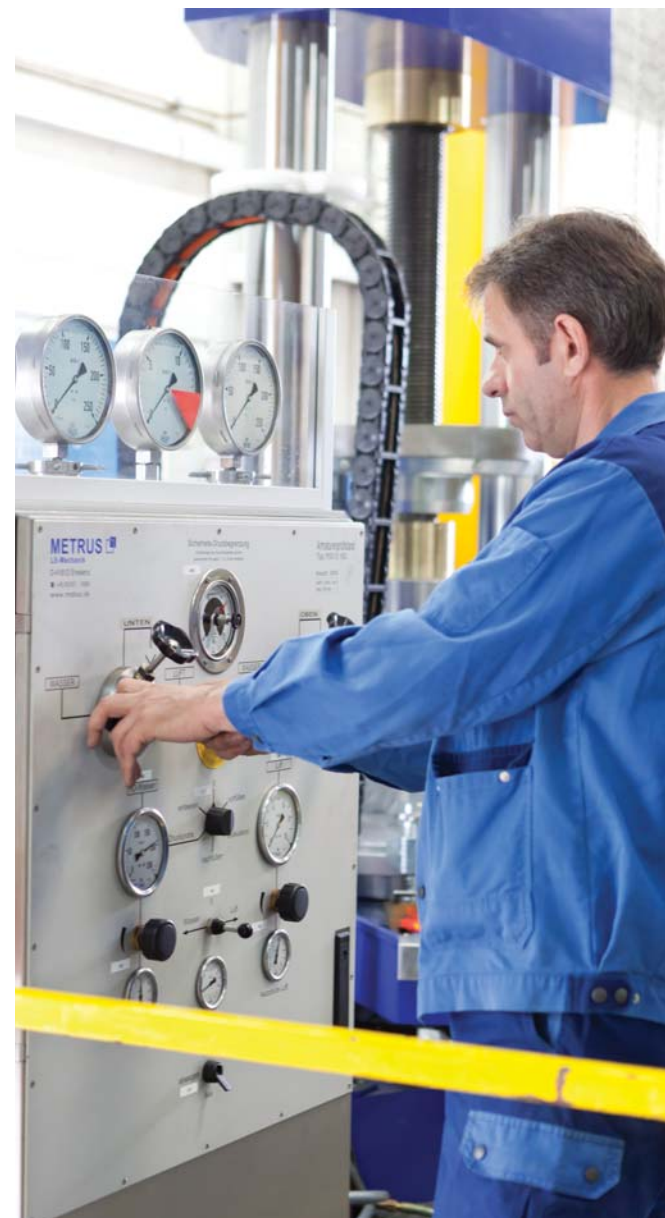
Metrus Prüfstand Druck- und Dichtigkeitsprüfung nach Wareneingang

Für die Zukunft des Unternehmens wünscht sich der Geschäftsführer weiteres gesundes Wachstum mit inno-