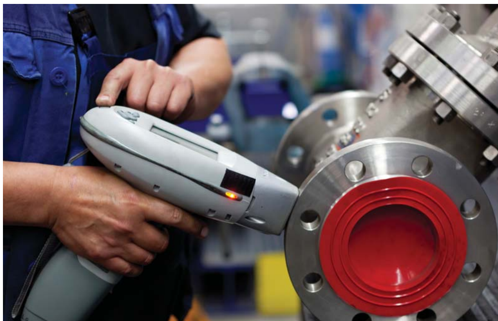
Hier findet die Materialidentifikation statt; PMI (Positive Material Identification)