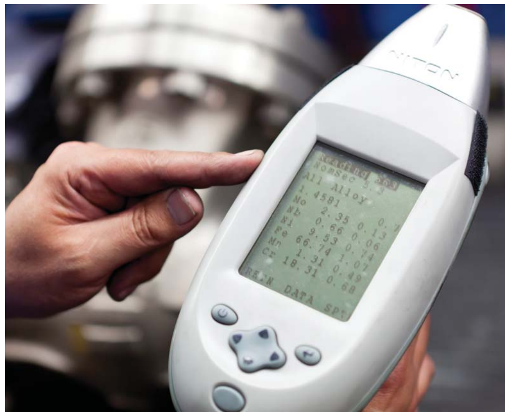
PMI-Anzeige der chemischen Zusammensetzung der Werkstoffe

und diesen Plänen sollte dem Unternehmen und seinem weiteren Erfolg nichts im Wege stehen; so geht es für AVA weiter auf dem aufsteigenden Ast.