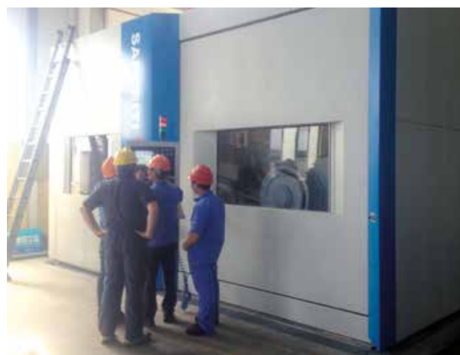
Installation der PV1800 im Werk eines Kunden

Das Unternehmen fertigt ausschließlich auf Bestellung. Damit jede Komponente den individuellen Anforderungen entspricht, gibt der Kunde seine Freigabe für die Hauptbestandteile. „Eine derartige Orientierung am Kundennutzen