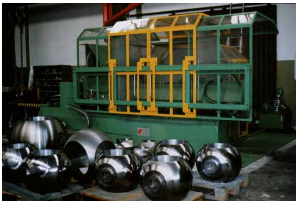
Erste CNC-Schleifmaschine von SAPORITI

Jedes PV-Modell wird auf Kundenanfrage mit Sonderausstattungen, wie z.B.