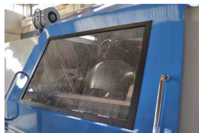
Arbeit an einem hart beschichteten Kugelventil