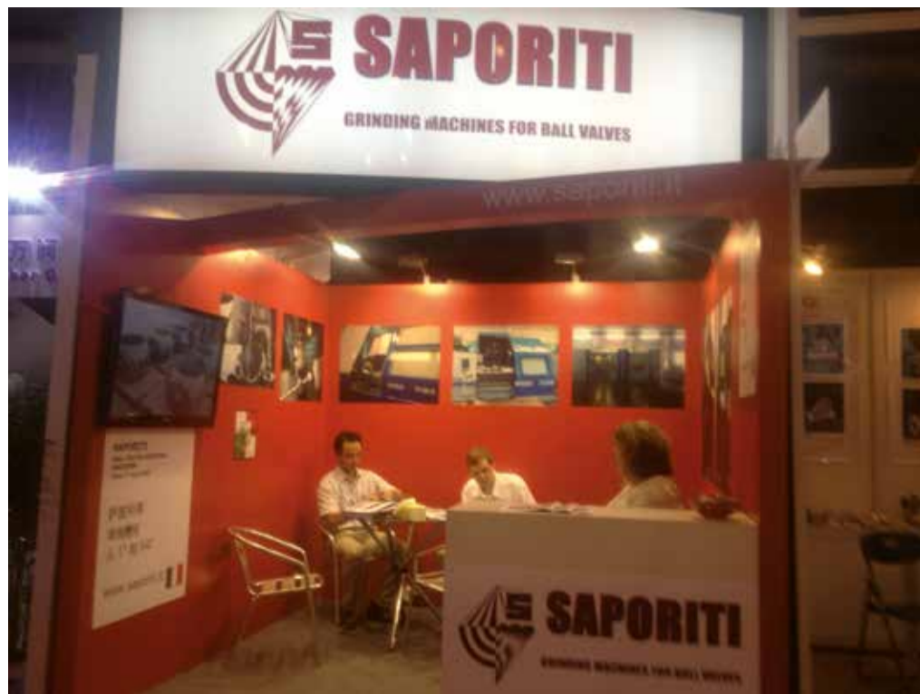
SAPORITI mit einem Stand auf der Valve World Expo & Conference